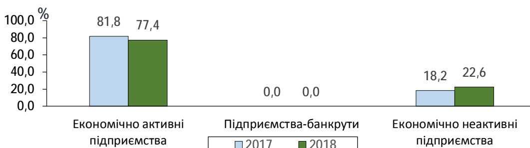
Структура заборгованості з виплати заробітної плати на 1 лютого 2017–2018 років (у % до загальної суми)

Заборгованість працівникам економічно активних підприємств у січні 2018р. збільшилась на 6,1%.